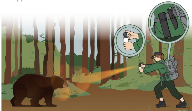
Illustration de l'utilisation d'un vaporisateur chasse-ours.